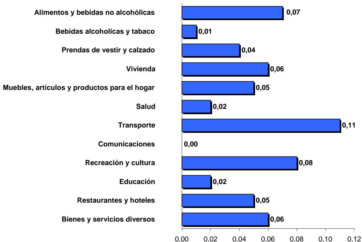
Incidencias según divisiones. Abril 2015

La suma de las incidencias puede no reproducir exactamente la variación total debido a redondeos